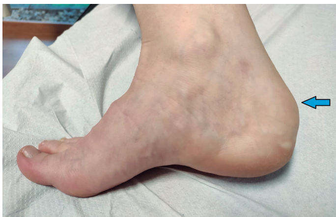
Figura 1. Imagen del pie