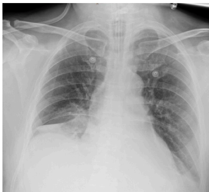
Figura 1. Radiografía de tórax donde destaca imagen de densidad de agua de aspecto circular y bordes bien delimitados en zona parahiliar derecha

Al quinto día de intubación se constató mejoría clínica, por lo que se procedió a la disminución de la sedación y destete. Se observó que al despertar el paciente presentaba disartria, baja agudeza visual bilateral, reflejo por amenaza abolido, debilidad de miembros superiores con marcada atrofia en el primer dedo de la mano izquierda, paresia distal izquierda 1/5 y derecha 3/5. En la resonancia