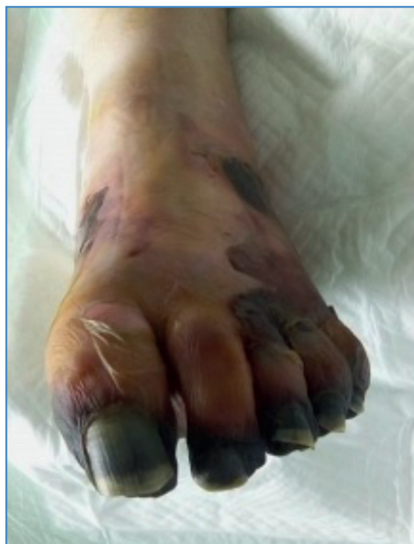
Figura 2. Isquemia distal parcheada en pie derecho en paciente COVID-19. Momificación del pulpejo del primer dedo.

palmente a las zonas acras y suele estar en relación, además, con dosis altas de catecolaminas. Debido a la naturaleza simétrica de las lesiones, Perry y Davie introdujeron el término gangrena simétrica periférica (GSP) en los años 80 (1).