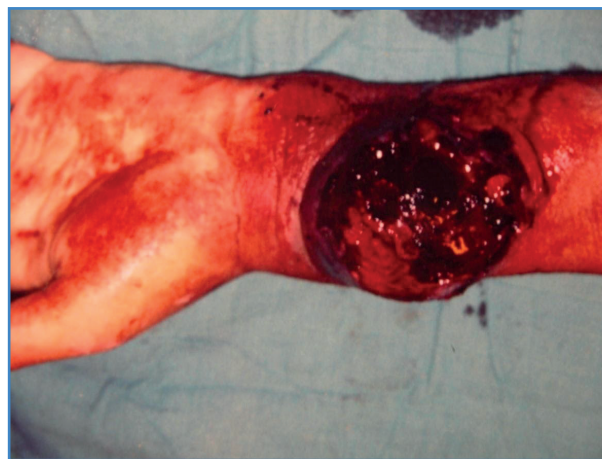
Figura 1. Vista preoperatoria que muestra a la exploración un pseudoaneurisma de la arteria radial roto.

En cuanto al tratamiento, comenzamos con 1 mg/kg de corticosteroides durante 1 mes, luego redujimos gradualmente la dosis y administramos 1 mg/día de colchicina. Los marcadores inflamatorios mostraron una cinética descendente con una normalización de la velocidad de la eritrosedimentación en 3 meses.