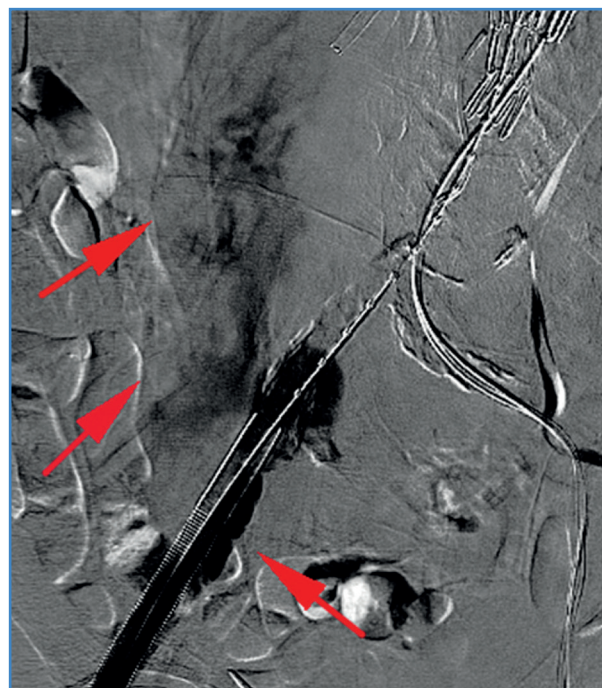
Figura 2. Ruptura de arteria ilíaca externa.

peratoria del 4,4 % (grupo A, 0 %, frente al grupo B, 9,1 %; p = 0,45 ). Una de las muertes fue la de una mujer debido a un shock hemorrágico secundario a una ruptura de la arteria ilíaca externa (Fig. 2) y la otra fue la de un hombre