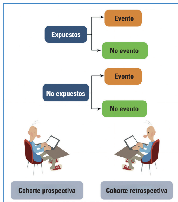
Figura 3. Relación del investigador con la exposición.