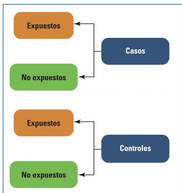
Figura 4. Secuencia temporal de los diseños de casos y controles.