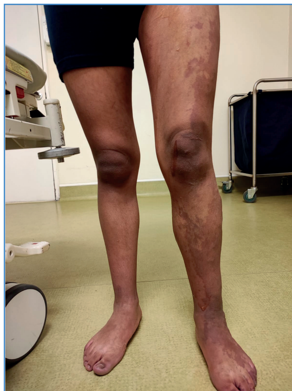
Figura 1. Mancha en vino de Oporto, edema e hipertrofia en miembro izquierdo.

En la exploración física se evidenciaron lesiones cutáneas maculares, confluentes, en vino de Oporto, con bordes geográficos no definidos, irregulares, no sobre elevados y que se extendían desde la cadera izquierda hasta el dorso del pie ipsilateral, edema y venas varicosas CEAP 4, predominantemente en la cara externa del muslo y en la pierna izquierdas, pulsos