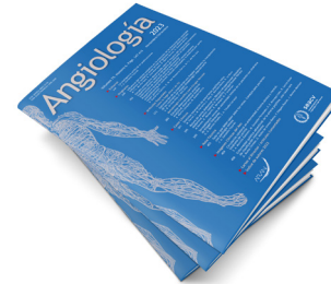
Imagen Clínica del Mes