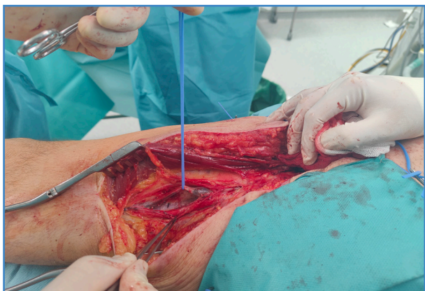
Figura 1. Posición del paciente durante la disección para la extracción.

Con el paciente en decúbito supino, se realiza la incisión longitudinalmente sobre el borde lateral del músculo sartorio, en función de la longitud necesaria (3,4) (Fig. 1).