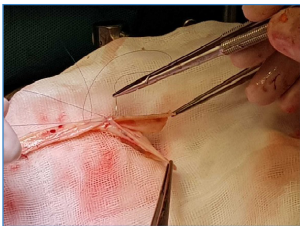
Figura 3. Confección de la plastia en V con vena femoral superficial.

En cuanto a la reconstrucción arterial aórtica, la anastomosis proximal puede realizarse de diversas maneras; la más común es una término terminal. En caso de que se necesite mayor diámetro de la vena,