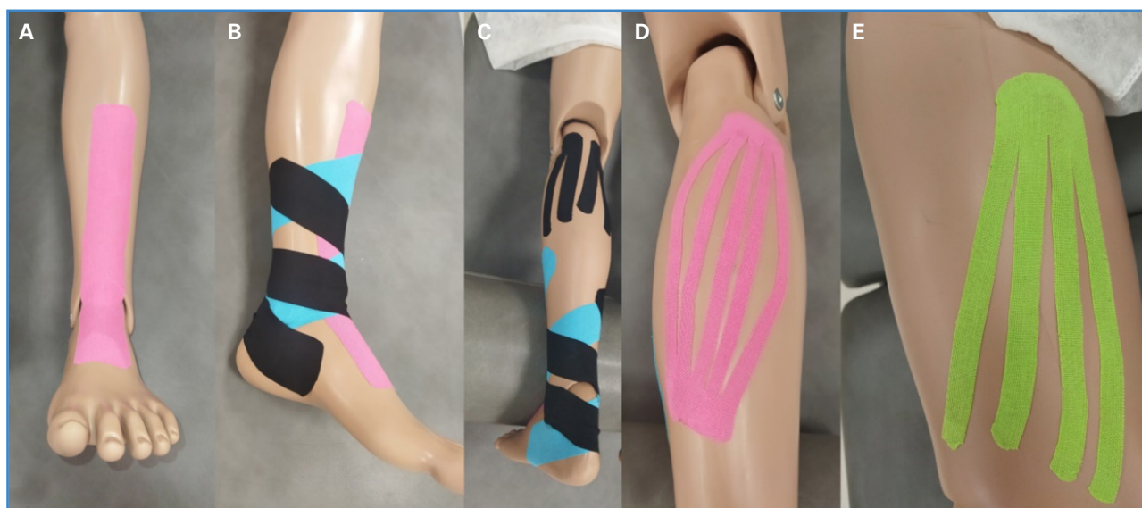
Figura 3. Aplicaciones del KT relacionadas con los estudios incluidos. A. Aplicación para corrección funcional del tobillo (corte en I sobre tibial anterior). B. Tiras para compresión venosa desde región maleolar interna y externa. C. Aplicación en Y para la estimulación de gastrocnemios. D. Corte en abanico cerrado. E. Corte en abanico abierto.

Las variables medidas entre todos los artículos están resumidas en la tabla III.