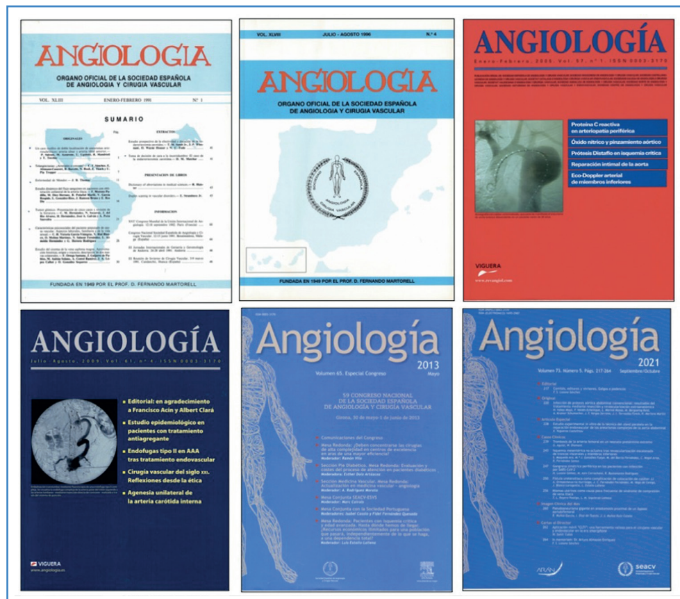
Figura 2. Portadas de la revista en distintas épocas.

El declive de Angiología coincidió con la pérdida de indexación internacional. Con el siglo xxi surgió el objetivo de su reindexación, como reflejan los editoriales de los sucesivos directores de la revista: Cairols (2001-2005), Acín (2005-2009), Vaquero (2009-2013), Lozano (2013-2017) y González Fajardo (2018-actualidad) (4-10) (Fig. 2).