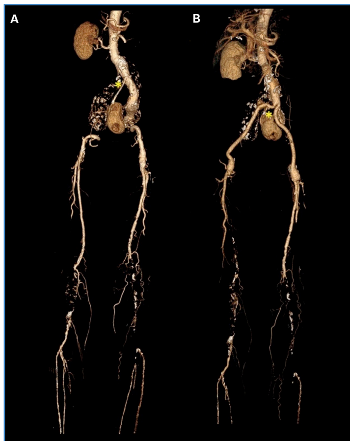
Figura 1. A. Reconstrucción tomográfica arterial antes de la cirugía. El asterisco indica la arteria renal de origen ectópico. B. Reconstrucción tomográfica arterial después de la cirugía. El asterisco indica la arteria renal.