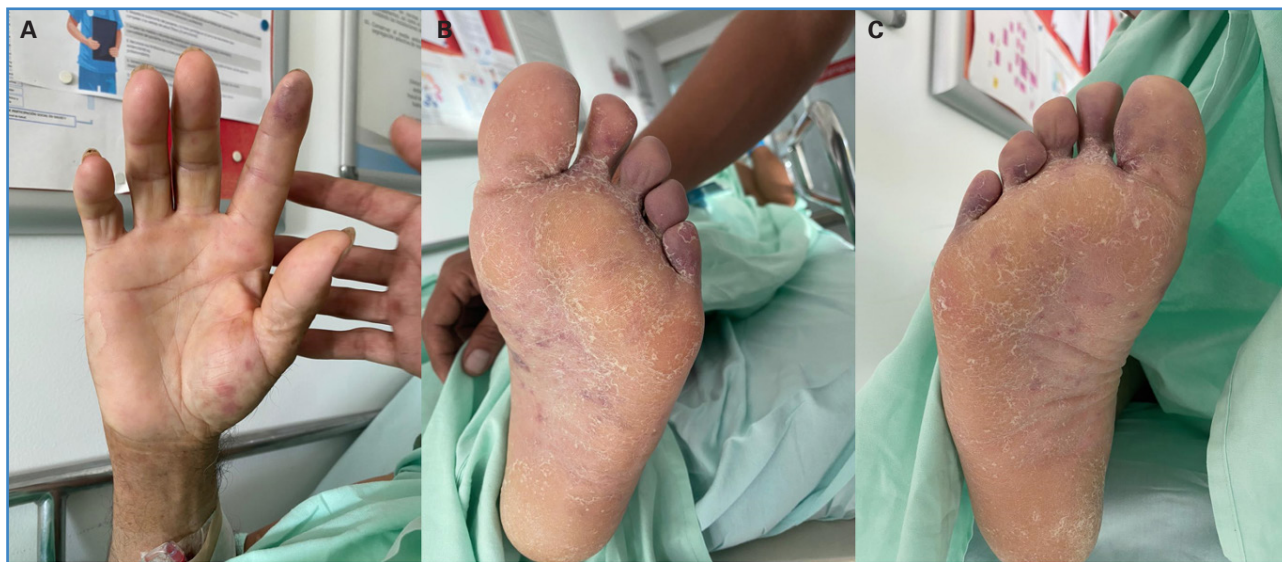
Figura 1. A. Coloración violácea en el dedo índice de la mano derecha y manchas hemorrágicas a nivel palmar. B. Coloración violácea del segundo dedo al quinto del pie izquierdo y manchas hemorrágicas en la región plantar. C. Coloración violácea en todos los dedos del pie izquierdo y manchas hemorrágicas en la región plantar.

Cuando ingresó, se indicó anticoagulación con heparina sódica, tratamiento analgésico y una angiotomografía de tórax y abdomen con reconstrucción de aorta ante la sospecha de síndrome aórtico agudo en curso o probable fractura de placa aterotrombótica de localización aórtica como fuente embólica. Se consideró poco probable el origen cardioembólico tras descartar la presencia de trombo apical o tumor cardíaco en el ecocardiograma de estrés realizado recientemente. No obstante, se reportó defecto de llenado en la aurícula izquierda por una lesión de apariencia neoformativa de aproximadamente 3 cm de diámetro (Fig. 2), que fue corroborado en ecocardiograma transtorácico institucional, además de una angiotomografía que no reveló la presencia de aneurismas aórticos. El caso fue llevado a la Junta Médico-Quirúrgica, donde se consideró