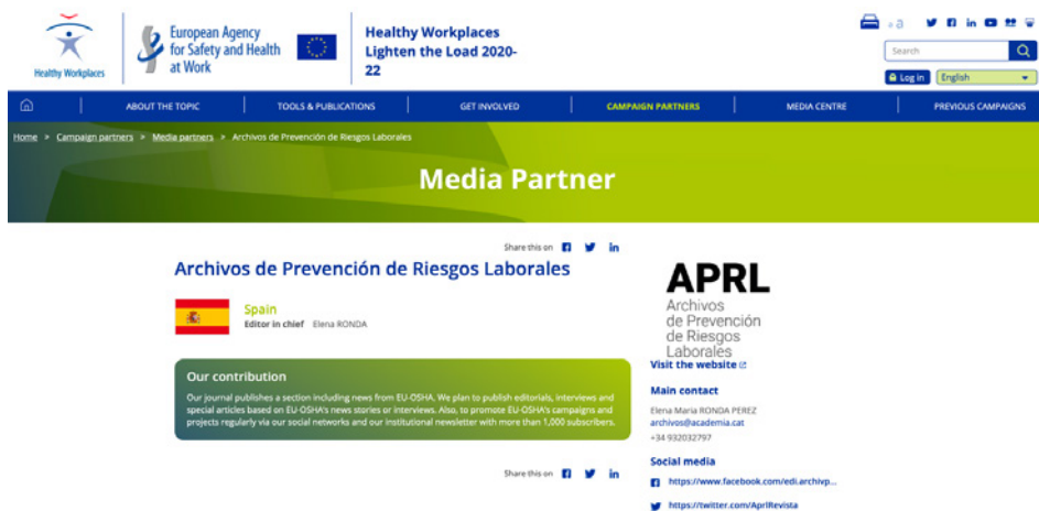
Figura 1: Web de la EU-OSHA en la que Archivos de Prevención de Riesgos Laborales figura como media partner .