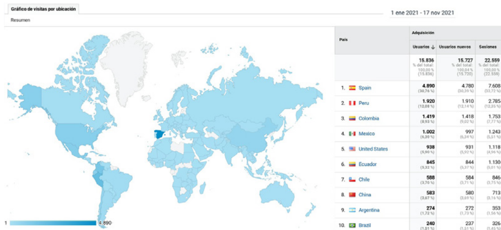
Figura 5: Informe de las visitas a la web según ubicación.

A través de un código de seguimiento de Google Analytics, se permite obtener información ampliada sobre los visitantes del sitio web: por ejemplo, su ubicación, género, edad o idioma. La figura 5 muestran que durante 2021 la web de Archivos ha sido visitada por más de 15 000 personas desde 145 países. Si bien la mayor parte de las visitas se producen desde España y Latinoamérica, debe resaltarse que han consultado nuestra web casi mil personas en Estados Unidos y más de 500 en China.