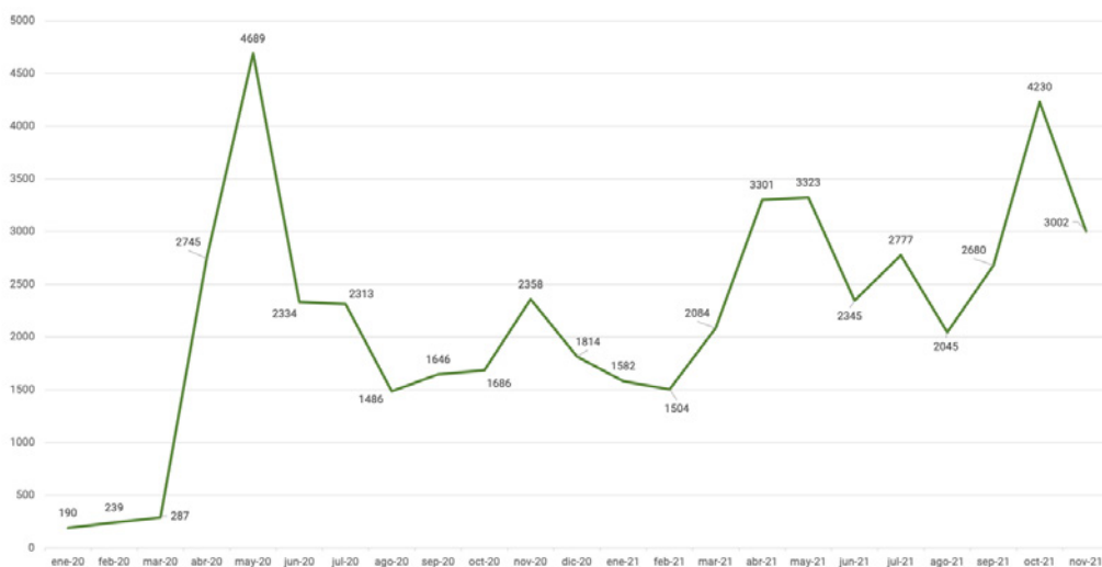
Figura 4: Evolución de la cifra mensual de consultas a los resúmenes de los trabajos publicados (enero 2020-noviembre de 2021).

A través de un código de seguimiento de Google Analytics, se permite obtener información ampliada sobre los visitantes del sitio web: por ejemplo, su ubicación, género, edad o idioma. La figura 5 muestran que durante 2021 la web de Archivos ha sido visitada por más de 15 000 personas desde 145 países. Si bien la mayor parte de las visitas se producen desde España y Latinoamérica, debe resaltarse que han consultado nuestra web casi mil personas en Estados Unidos y más de 500 en China.