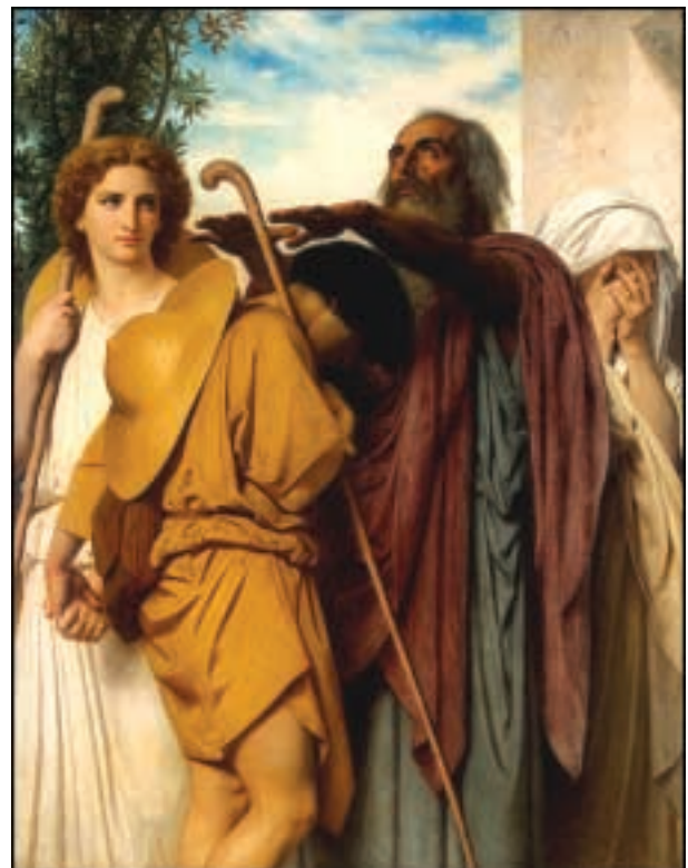
Fig. 2: Tobías diciendo adiós a su padre, 1866, por Adolphe William Bouquereau. The State Hermitage Museum, San Petersburgo.