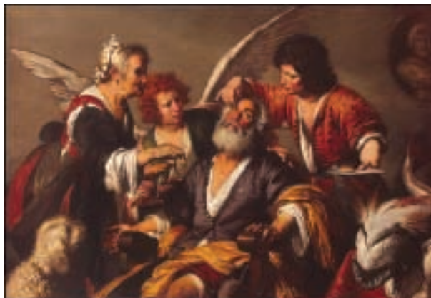
Fig. 3: Tobías curando la ceguera de su padre , 1630-35, por Bernardo Strozzi (Il Prete Genovese) (1581-1644). The State Hermitage Museum, San Petersburgo.