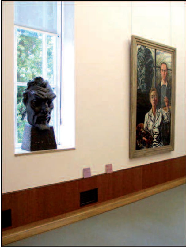
Las tres Generaciones en el Museo Boijmans van Beuningen de Rotterdam.