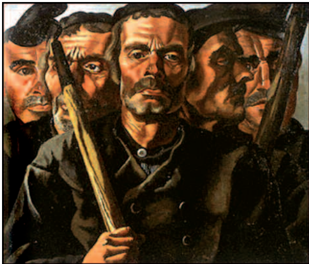
Cuatro campesinos de Zelanda (1930).

La agnosia visual originada por lesiones en el lóbulo occipital constituye un desorden que hace que el paciente tenga dificultades para reconocer los objetos comunes en el espacio pero sin presentar dificultades motoras. Un paciente con agnosia visual será incapaz de reconocer o copiar dibujos de cosas familiares como un coche, pero en cambio, será capaz de dibujar objetos de memoria ya que el problema radica en la identificación de los objetos basada en la información visual (3).