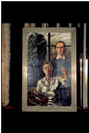
Las tres generaciones (1950).