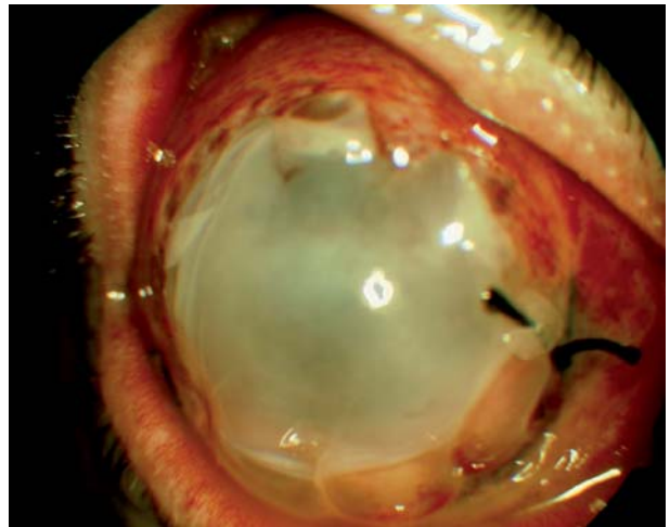
Fig. 2: Recubrimiento corneal con membrana amniótica.

Las infecciones oculares en adultos por Neisseria Gonorrhoeae se han considerado como una enfermedad poco común, pero con el incremento reciente de las enfermedades de transmisión sexual ha aumentado su incidencia.