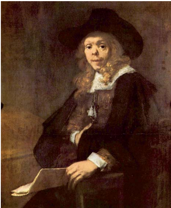
Rembrandt. Retrato de Gérard de Lairese, 1665. Metropolitan Museum of Art.