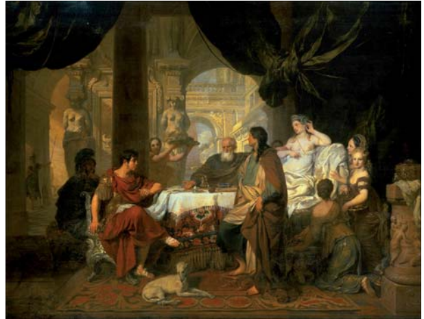
Gérard Lairese. El banquete de Cleopatra, 1680.