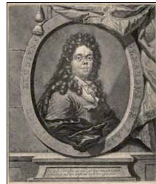
Grabado realizado por Pieter Schenck en 1707 representando a Lairese.

Su facilidad para el dibujo quedó demostrada en los grabados anatómicos que realizó para la obra