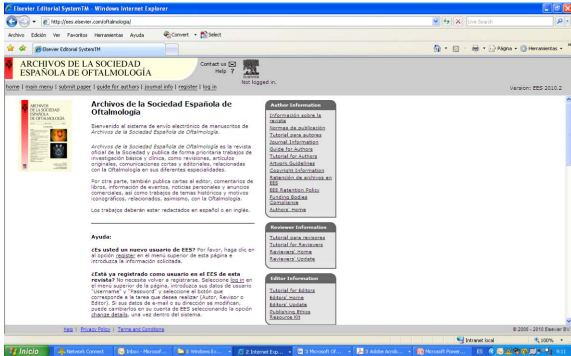
Figura 3 – Página web de envío de manuscritos (EES) de Archivos de la Sociedad Española de Oftalmología.