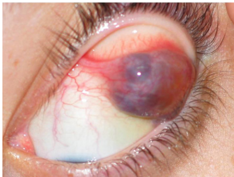
Fig. 2 - Linfangioma al evertir el párpado.

intralesionalmente. No experimentan cambios de volumen con la maniobra de Valsalva. La localización más frecuente de los linfangiomas palpebrales es en párpado superior y tercio interno. Nuestro caso es superoexterno 1 .