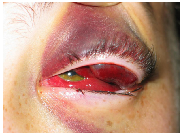
Fig. 5 - Aspecto de la lesión postratamiento con un aumento del contenido del linfangioma.

Se extraen 0,02 ml del contenido del linfangioma, bajo anestesia general para su estudio anatomopatológico. A continuación, se inyectan intralesionalmente 0,02 mg de la sustancia esclerosante OK-432 en el linfangioma. No se producen efectos secundarios ni locales en el momento de la aplicación del OK-432. Aunque el procedimiento es sencillo, se