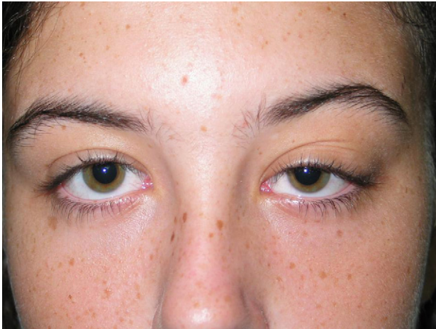
Fig. 1 - Paciente el 1.º día, se aprecia la ptosis mecánica.