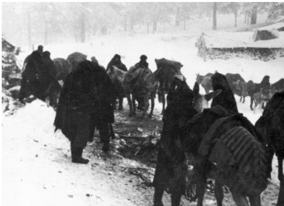
Figura 1. Columna de acemileros de la Primera División de Navarra en las inmediaciones de la ciudad de Teruel. Las condiciones meteorológicas fueron excepcionales durante la batalla, con temperaturas de hasta veinte grados centígrados bajo cero.

bataban la manta, era como si le firmasen su condena de muerte. Por las noches se apretujaban unos a otros, temblando, en busca de algo de calor 12 .