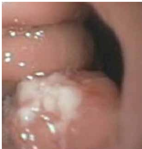
Figura 1. Gastroscopia mostrando tumoración excrescente en esófago distal sobre cardias.

A lo largo del ingreso fueron necesarias varias transfusiones y se inició tratamiento con somatostatina pese a lo que el sangrado se mantuvo activo. Se inició entonces tratamiento radioterápico de carácter paliativo con intención hemostática administrándose 20Gy en 5 fracciones de 400cGy con buena tolerancia digestiva y consiguiendo la remisión de los episodios de sangrado. El paciente fue dado de alta quedando asintomático durante otros 5 meses tras los que falleció por diseminación metastásica.