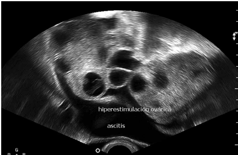
Figura 2. Ecografía de la hiperestimulación ovárica.

Junto con la clínica, que es la base del diagnóstico, la confirmación exige la realización de una ecografía pélvica (Fig. 2) para valorar el tamaño de los ovarios y la ascitis, además en algunos casos se pueden necesitar otras pruebas complementarias que ayuden a estadiar la gravedad del proceso y a controlar su evolución.