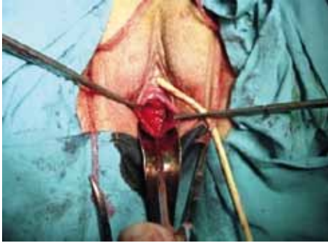
Figura 2. Cirugía vaginal.