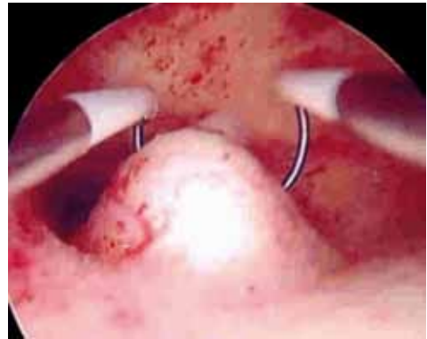
Figura 7. Resectoscopio.

durante la utilización posterior del resector histeroscópico de forma mecánica o como injuria eléctrica. Ante su sospecha se debe interrumpir intervención, ingreso y antibióticos. Si se sospecha hemoperitoneo o lesión de órgano pélvico se debe acceder a la cavidad abdomino-pélvica. Cuando la perforación es electroquirúrgica, ante el riesgo de daño de órganos pélvicos siempre debe realizarse laparoscopia-laparotomía (Fig. 7).