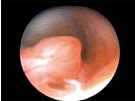
Figura 6. Pólipo endometrial.

Se puede realizar con fines diagnósticos y/o terapéuticos (histeroscopia quirúrgica) con o sin anestesia (Fig. 6).