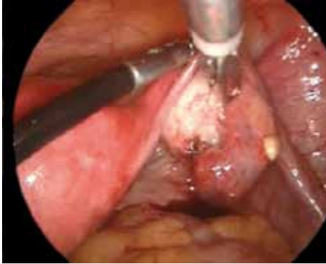
Figura 4. Gestación ovárica.

Estas técnicas tienen unas complicaciones que no son superponibles a la cirugía abierta, sino que son específicas de las mismas: creación de neumoperitoneo, colocación de trócares, coagulación a distancia, paso vascular de glicina empleada en la distensión uterina durante la histeroscopia, etc.