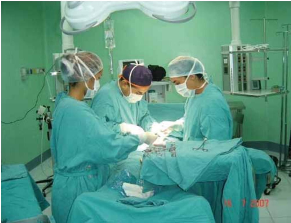
Figura 1. Cirugía abierta.

daño visceral (vejiga, recto, uréteres) y de los grandes vasos pélvicos. Son más frecuentes en la cirugía oncológica o cuando la anatomía está distorsionada debido a infección o a endometriosis. El factor más importante que determina el éxito de su tratamiento, es el reconocimiento precoz de las complicaciones. Por ello, es tan importante la observación sistemática y cuidadosa del post-operatorio, particularmente: pulso, presión sanguínea, función respiratoria, temperatura, diuresis, hemograma, etc.