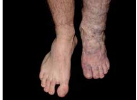
Figura 2. Malformación venosa extensa que engloba todo el perímetro de la extremidad inferior. Nótese el acortamiento respecto a la extremidad contralateral y la disminución de tamaño del pie afecto.

En las malformaciones venosas puras o combinadas se han descrito trastornos de la coagulación. Concretamente una coagulación intravascular localizada, caracterizada por un consumo local de factores de la coagulación dentro de la malformación o secundario al éstasis venoso, como consecuencia del cual se forman los microtrombos y los flebolitos. Analíticamente el fibrinógeno suele estar bajo (menor de 0,1 g/l) y el dímero-D elevado 26,27 . En un estudio reciente de 280 pacientes con malformaciones vasculares, 195 de ellos (69,6%) tenían malformaciones venosas, mientras que 85 pacientes presentaban otro tipo de lesiones 28 . En el primer grupo, en 83 pacientes la detección plasmática de dímero-D fue muy alta, mientras que en el grupo de las no venosas, sólo en 3 pacientes el dímero-D estaba elevado. La sensibilidad fue 42,6% (95CI, 35,6-49,5%) y la especificidad 96,5% (95 CI-92,5-100%). El estudio concluye que el dímero-D es muy específico de malformaciones venosas, ya sean puras, combinadas o sindrómicas y que este test analítico puede ser muy útil para confirmar el diagnóstico clínico, así como para el diagnóstico diferencial res-