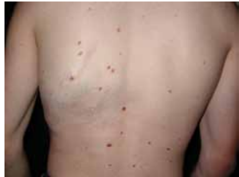
Figura 1. Paciente varón con malformación venosa extensa en región toraco-abdominal izquierda, con un patrón metamérico que se extiende hacia la espalda. Se aprecia cicatriz secundaria a cirugía en la infancia.