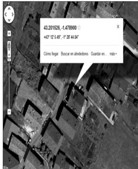
Figura 1. Mapa dibujado y foto de Google maps de Amaiur.

Con esas coordenadas se han generado archivos de datos, cuyo encabezamiento es el nombre del pueblo y el contenido dividido en si el caserío se encuentra en núcleo poblacional o si está diseminado (fuera del pueblo). Igualmente se han especificado los barrios de los diferentes pueblos. Con todo esto se han generado bases de datos en los que existe una correspondencia entre caseríos, pueblo o barrio de pueblo al que pertenecen y sus correspondientes coordenadas. Estas bases de datos se han introducido en Google maps para generar archivos KML para su posterior exportación a distintos dispositivos GPS 12 . Los KML también han sido divididos en pueblos y barrios y se han ordenado todos los caseríos alfabéticamente para que su búsqueda a la hora de utilizar el GPS sea lo más sencilla posible 13-15 . Posteriormente se ha pretendido buscar la forma de utilizar esos archivos de coordenadas, cómo compartirlos y cómo integrarlos en diferentes dispositivos. De esta manera se ha conseguido compartir