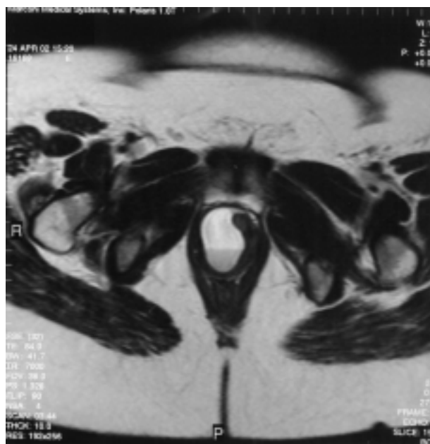
FIGURA 3. RMN de la pelvis, plano transversal.

normales y ortotópicos. No se encontraron alteraciones en el resto de la vejiga. La impresión diagnóstica fue de divertículo uretral complejo con dos ostium a las 7 del horario cistoscópico en la uretra media.