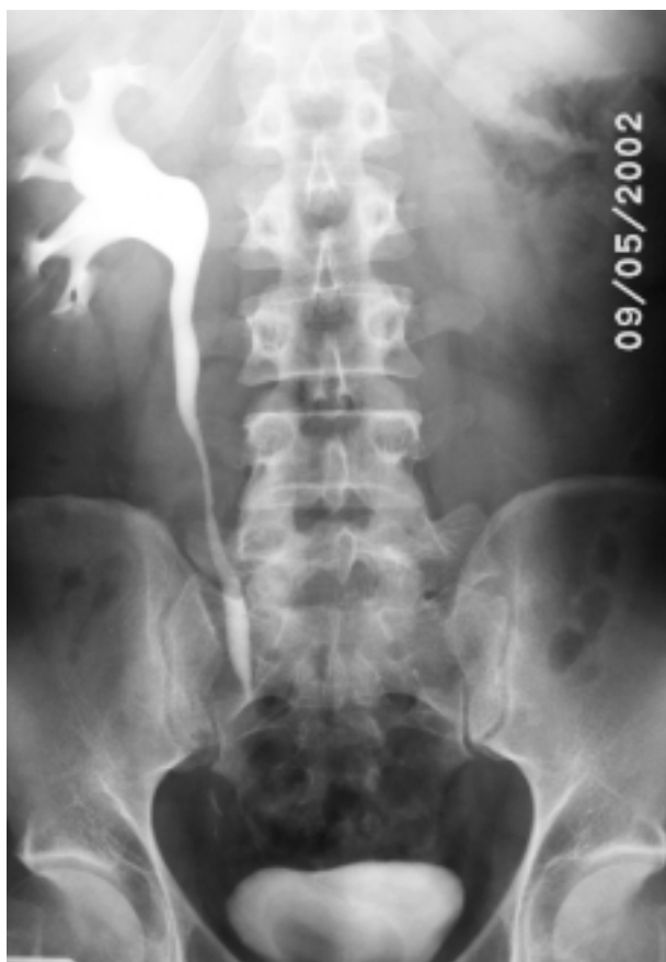
FIGURA 1. UIV donde se aprecia la ausencia completa de la unidad nefroureteral izquierda.

Varón de 38 años de edad, sin antecedentes de interés, que acudió a la consulta de urología solicitando la realización de una vasectomía. La exploración física reveló un sujeto normoconstituido, con pene, testes y epidídimos de tamaño y consistencia normales. Se palpaba claramente el conducto deferente derecho. No ocurría así con conducto deferente izquierdo que no se lograba palpar dentro del cordón espermático. El tacto rectal resultó anodino. Ante la sospecha de agenesia del conducto deferente se realizó una ecografía transrectal en la que no se visualizó la vesícula seminal izquierda. Una UIV (Fig. 1) reveló la ausencia completa del riñón izquierdo. Posteriormente, una RNM confirmó la ausencia de la vesícula seminal, del conducto deferente y del uréter izquierdos (Fig. 2). El paciente fue programado para vasectomía que se realizó sin incidencias en el lado derecho. Los seminogramas de control realizados a los tres meses de la intervención revelaron una azoospermia completa confirmando la sospecha clínica de agenesia deferencial asociada a agenesia renal y de la vesícula seminal homolateral. Se aconsejó a los familiares de primer grado del paciente (dos hijos, hermano varón y sendos hijos de éste) la realización de un estudio ecográfico, ante la potencial transmisión con carácter autosómico dominante de la agenesia renal, constatándose la presencia de ambos riñones en todos ellos. El test del sudor en el paciente fue asimismo negativo.