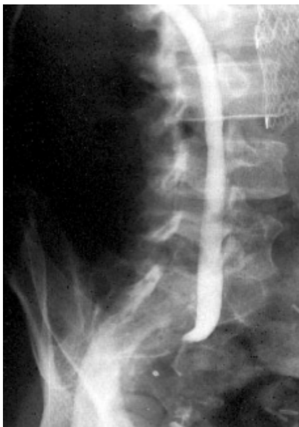
FIGURA 2. Opacificación realizada tras la colocación de la primera nefrostomía, en la que se evidencia una dilatación importante de todo el sistema derecho, con unafilamiento de su porción distal que permite un paso filiforme de contraste hacia neovejiga.

Se inicia el primer ciclo de quimioterapia con carboplatino y vinblastina, (dado el estado del