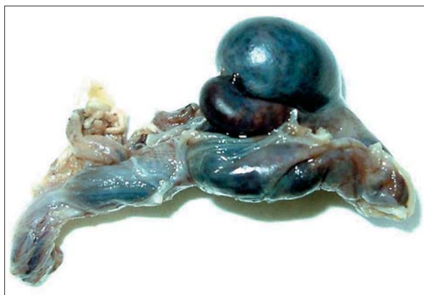
FIGURA 4. Necrosis hemorrágica testicular.

Ney y cols. 7 presentan un caso en el que el estudio doppler testicular en presencia de gran hidrocele a tensión en un adulto de 48 años objetiva disminución severa del flujo diastólico y desaparición del flujo venoso, lo que sugiere que puede existir compromiso del retorno venoso y predisponer al infarto testicular, como demuestra la evolución, con normalidad de la vascularización testicular tras punción del hidrocele.