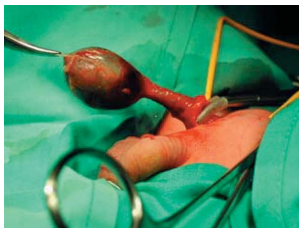
FIGURA 3. Testículo necrótico.

suele estar relacionado con la torsión intravaginal del cordón espermático, epididimo-orquitis severas, post-herniorrafia o traumatismos escrotales 5-8 .