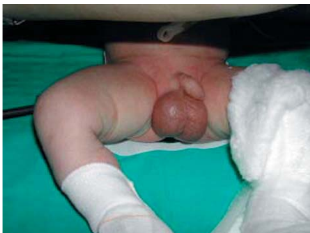
FIGURA 1. Hidrocele bilateral, a tensión en hemiescrotó derecho.

En la analítica sanguínea destaca moderada leucocitosis. El sedimento de orina fue normal. La ecografía doppler se realizó ajustando a los niveles más bajos del ecógrafo tanto la frecuencia de pulso como el filtro de pared. Los hallazgos fueron de hidrocele bilateral, siendo de gran tamaño el del lado derecho, presentando el teste derecho flujo doppler arterial conservado, aunque con un índice de resistencia (IR) elevado (IR=0,82; Normal: 0,48-0,75), ausencia de flujo venoso y ecogenicidad heterogénea, sugiriendo áreas de desestructuración. El testículo izquierdo es normal ecográficamente, presentando una velocidad de pico sistólica de 11 cm/s y diastólica de 5 cm/s, siendo el IR de 0,55.