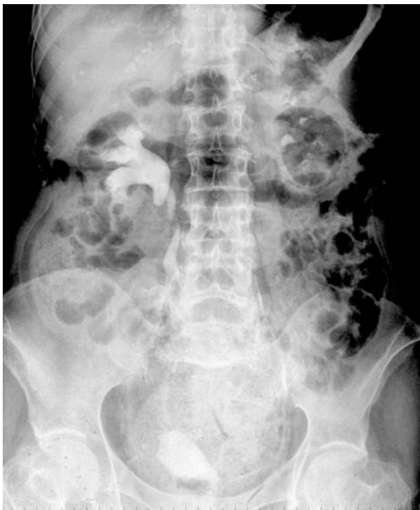
FIGURA 1. Urografías: se aprecia una buena eliminación de contraste bilateral, con una moderada ectasia pielocalicial izda. Desplazamiento vesical.

En posteriores controles se ha notado mejoría de su cuadro miccional y control del estreñimiento.