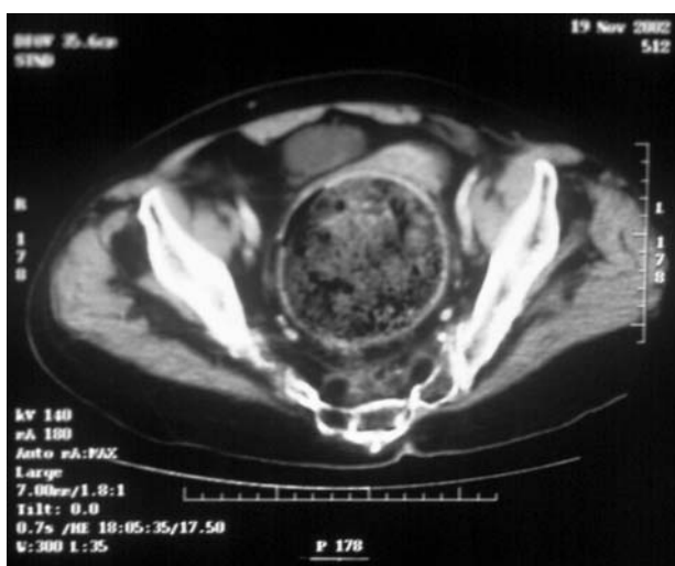
FIGURA 3. Scann pélvico donde se aprecia fecaloma gigante a nivel de recto-sigma.

miento aumenta la probabilidad de aparición de una incontinencia en presencia de una agresión fisiológica, farmacológica o patología asociada.