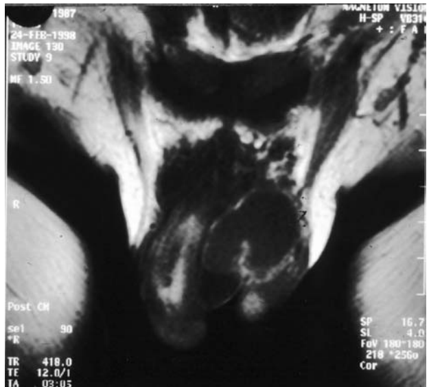
FIGURA 2. Resonancia magnética nuclear (RMN), región genital: tumor poliquístico sin conexión con el cuerpo cavernoso, la uretra o testículos.

mente por la base del pene hasta la sínfisis púbica, llegando dorsalmente hasta la fascia del músculo recto mayor del abdomen. El estudio anatómopatológico del espécimen demostró vasos linfáticos con un lumen ancho con eritrocitos y linfocitos compatible con un linfangioma cavernoso. El post-operatorio transcurrió sin complicaciones. En la actualidad el paciente se encuentra asintomático y no se observa recurrencia local.