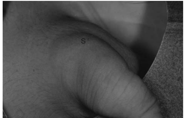
FIGURA 1. Varón de 10 años de edad. Tumor fluctuante, azulado, e indoloro (S) en el escroto y la base penil.

En el acto quirúrgico, macroscópicamente se observaba un tumor poliquístico, subcutáneo, con pequeñas hemorragias, parcialmente relleno de líquido seroso, que se extendía semicircular-