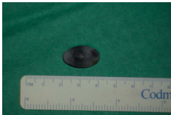
FIGURA 4. Litiasis de 2,2 cm extraída