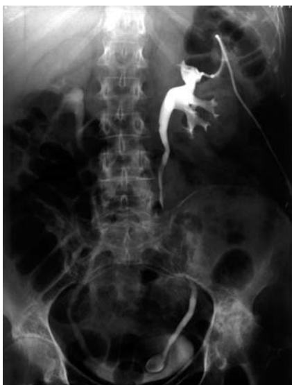
FIGURA 2. UIV: imagen en "cabeza de cobra" con cálculo en su interior.