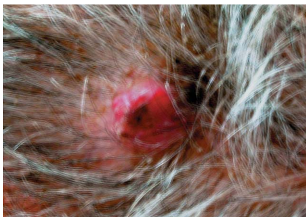
FIGURA 2. Aspecto de la lesión cutánea en cuero cabelludo tras el rebanado.

(Figs. 3 y 4). A los 7 meses presenta múltiples focos de hipernefroma en riñón izquierdo y nódulos en páncreas evolucionando en los siguientes meses a un cuadro de deterioro neurológico progresivo provocado por múltiples lesiones metastásicas cerebrales, así como aumento de las metastásis preexistentes y aparición de otras en territorio torácico falleciendo 15 meses tras el diagnóstico de la metastásis cutánea de carcinoma de células claras.