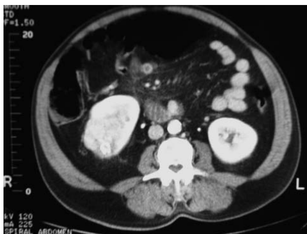
FIGURA 1. TC abdominal. Neoformación heterogénea que capta contraste en riñón derecho.