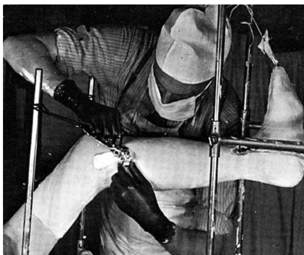
FIGURA 2. Trueta realizando una de sus "curas oclusivas" de traumatismo abierto de la extremidad inferior.

desarrollo y patología del hueso, algunas de las cuales siguen vigentes, y, entre otras áreas, en el conocimiento de la función renal y las lesiones renales inducidas por el shock y la hipertensión arterial 1-6 .