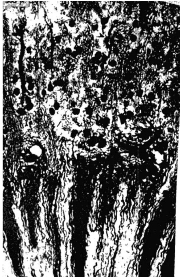
FIGURA 6. Riñón de conejo inyectado con contraste, en que se demuestran los vasa recta agrupados de forma compacta en la zona subcortical (abajo). Tomado de Trueta et al 8 .

Los trabajos de Trueta son un extraordinario ejemplo de estudios dirigidos a responder a preguntas clínicas concretas. Llama la atención el amplio campo de investigación en que se mueve, que hoy día implicaría a diversas especialidades muy ajenas a sus tareas de