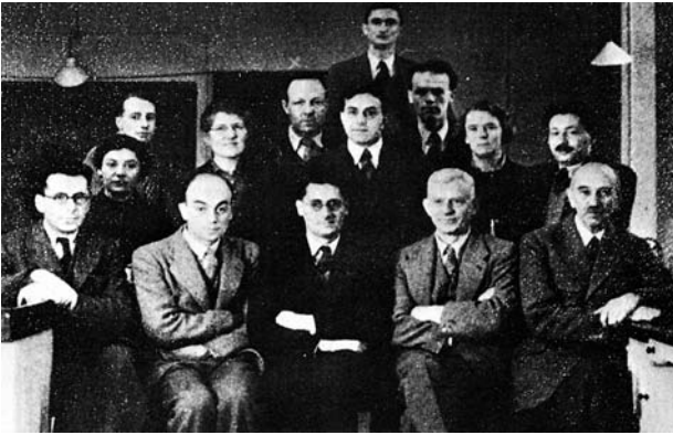
FIGURA 3. Trueta (X) con el grupo de investigadores de la penicilina en Oxford (1941). En la primera fila los premios Nobel Howard W. Florey (centro) y Ernst B. Chain (a su derecha).