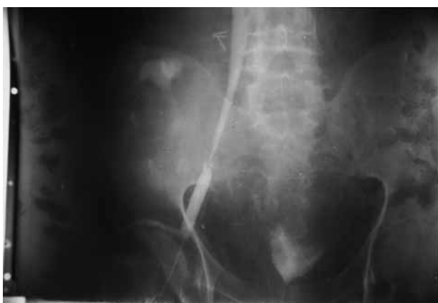
FIGURA 2. Venografía: importante reducción del calibre de la vena iliaca externa a la altura de la anastomosis con la vena del injerto renal.

En la cirugía se confirma una lesión fibrosa que infiltra seno renal y vasos ilíacos y que se logra resecar parcialmente, liberando uréter y vena iliaca, correspondiendo la anatomía patológica a un KS. El estudio abdominal (incluyendo endoscopia digestiva) descarta afección de otros órganos. Ante estos hallazgos se propone al paciente retirar la inmunosupresión y vigilar la evolución. A los 3 meses de la cirugía y con injerto funcionando se detecta una progresión local de la enfermedad que se extiende a pared abdominal, por lo que se decide iniciar quimioterapia (doxorubicina, vincristina y bleomicina). A pesar de mantener una función renal normal y no objetivarse lesiones a distancia, no se obtiene respuesta a nivel local, falleciendo el paciente a los 9 meses del diagnóstico por grave malnutrición y sepsis.