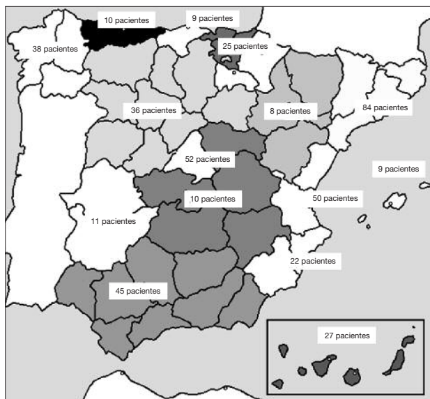
FIGURA 2. Distribución de los pacientes encuestados en fase III: Validación del cuestionario CAVIPRES-30 (n=436).

dores de la calidad de vida permitió explorar la validez de constructo (Tabla 5). La población con pareja estable presentaban puntuaciones del CAVIPRES-30 significativamente más altas en la dimensión Aspectos psicológicos y en Comunicación e información ( p < 0,001 ).