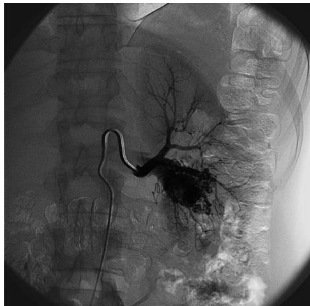
FIGURA 2. Arteriografía. Fístula arteriovenosa de aspecto cirsoide a nivel del polo inferior.