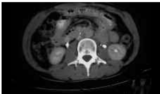
FIGURA 5. Control caso 2.

El papel de la cirugía sigue siendo esencial, tanto en la orquiectomía radical de inicio como en la exéresis de masas residuales retroperitoneales tras quimioterapia.