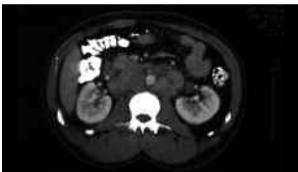
FIGURA 1. Caso 1.

E l avance en el tratamiento quimioterápico del tumor testicular, en sus diferentes esquemas, ha supuesto que, aún en presencia de afectación metastásica importante, el porcentaje de curación sea elevado.