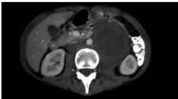
FIGURA 3. Caso 2.