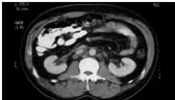
FIGURA 4. Control caso 1.