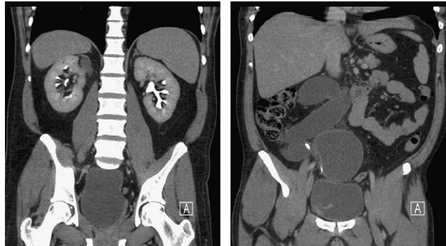
Figuras 1 y 2 – Paciente de 53 años con cuadro infeccioso por colección de 3 litros de pus abacteriano en duplicidad ureteral ectópica. Cistoscopia y peilografía retrógrada demuestran orificio ureteral obstruido a nivel de la próstata.