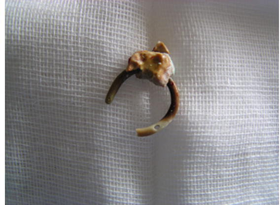
Figura 2 – Retirada del extremo piélico del catéter doble J con incrustación mediante acceso percutáneo, tras intento sin éxito en el mismo acto de retirada vía retrógrada con ureterorenoscopia.

Servicio de Urología II, Hospital Universitario Central de Asturias, Oviedo, España