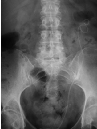
Figura 1 – Rotura del extremo piélico en el mismo acto que obligó a colocar nuevo doble J izquierdo.

J.M. Abascal Junquera*, M. Hevia Suárez, J.M. Abascal García y R. Abascal García