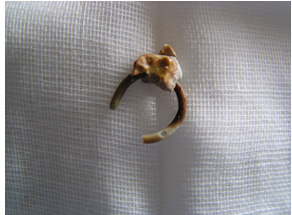
Figura 2 – Retirada del extremo piélico del catéter doble J con incrustación mediante acceso percutáneo, tras intento sin éxito en el mismo acto de retirada vía retrógrada con ureterorenoscopia.

Servicio de Urología II, Hospital Universitario Central de Asturias, Oviedo, España