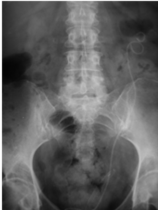
Figura 1 – Rotura del extremo piélico en el mismo acto que obligó a colocar nuevo doble J izquierdo.