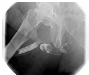
Figura 1 – Uretrografía retrograda en proyección oblicua.