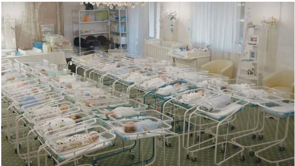
Imagen 1: Bebés nacidos por gestación subrogada varados en un hotel en Ucrania.

Algunos medios de comunicación internacionales (BBC News Mundo, 2020) reportaron esta situación, ocasionada por las estrictas medidas de confinamiento impuestas por los gobiernos a nivel internacional y local, las cuales eran imposibles de superar por las personas involucradas en esta práctica. Esto ocasionó que muchos bebés vivieran los primeros días de su vida distanciados tanto de sus padres intencionales como de las madres subrogantes, en un ambiente de soledad en centros médicos y hoteles, sin recibir el cuidado de una familia, puesto que, aunque el personal médico y asistencial atiende las necesidades básicas de un niño, no puede reemplazar la figura de un familiar, menos el de una madre (Ver imagen 1).