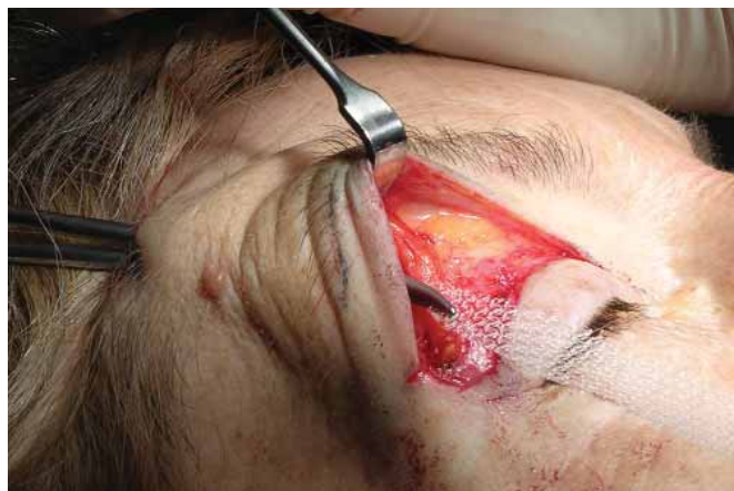
Figura 3 : Tunelización suprapariosteal entre ambas incisiones y colocación de la malla

de la glándula lagrimal, rebaje del borde orbitario, o tratamiento de los músculos depresores mediales (corrugador, procerus, etc).