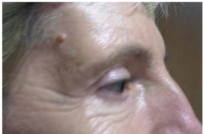
Figuras 6, 7 y 8: Imágenes pre y postoperatorias de una mujer de 45 años a la que se le ha practicado una blefaroplastia superior y nuestra técnica de lifting frontal, a los 12 meses de la intervención.