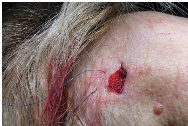
Figura 5 : La malla se sujeta a la galea a nivel de la incisión superior con puntos transfixiantes, eliminándose el exceso de la misma para acomodarla posteriormente en su plano

tando el exceso de malla y acomodándola por debajo de la galea (fig 5). Este punto nos sirve para fijar la malla a la galea en su punto, y así descargar la tensión durante la primera semana, en tanto que comienza la cicatrización y las fibras de colágeno y el resto de la trama comienzan a atravesar y fijar la malla.