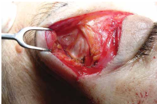
Figura 2 : La incisión inferior llega al plano perióstico. Nótese que se ha retirado el músculo orbicular preseptal.