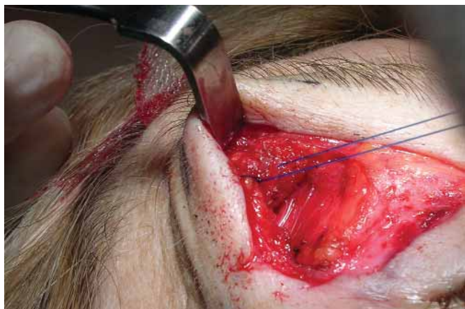
Figura 4 : La malla se ha sujetado con puntos sueltos a la galea a nivel de la incisión inferior