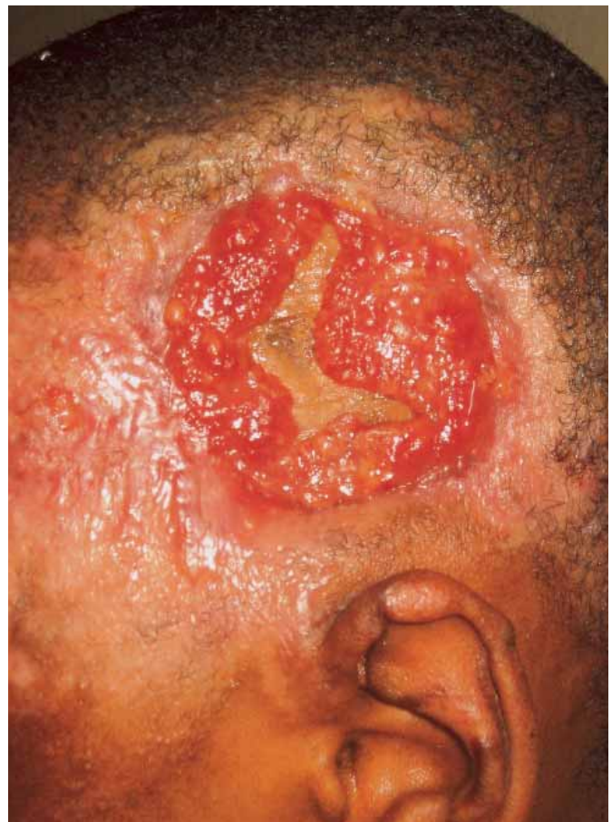
Figura 2: Detalle.