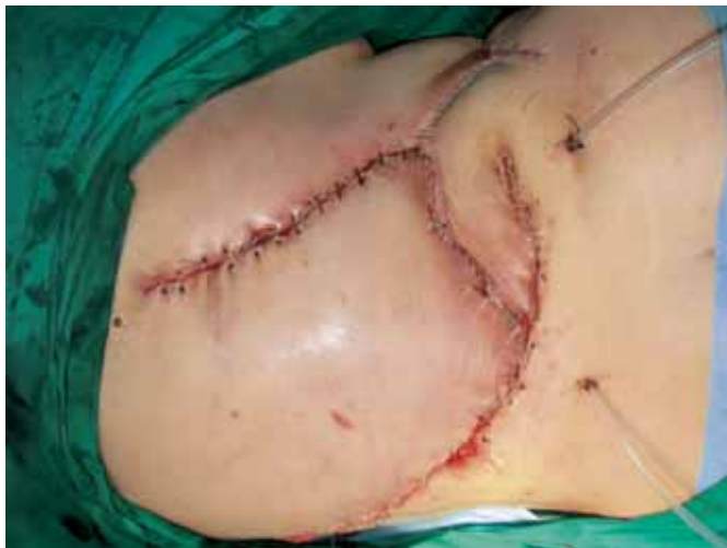
Fig. 5: Colgajo de perforantes lumbares rotado 180°.

En el caso que presentamos, se trataba de una paciente con deambulación normal, tejido radiado y un defecto de gran tamaño. El planteamiento inicial de utilización de un colgajo de dorsal ancho miocutáneo de grandes dimensiones para recubrir el defecto original sobre los cuerpos vertebrales nos pareció el más adecuado por su rica vascularización, reservando el colgajo basado en las perforantes lumbares con una rotación de 90° para cerrar el defecto causado por la movilización del dorsal ancho. Sin embargo, la necrosis del extremo distal del dorsal ancho nos obligó a diseñar un colgajo basado en las perforantes lumbares contralaterales con una rotación de 180°. Ambos colgajos de perforantes no llegamos a levantarlos en isla, sino que la disección finalizó al hallar la salida de la arteria perforante, preservando el pedículo cutáneo medial, debido a la buena movilidad y adaptación del mismo.