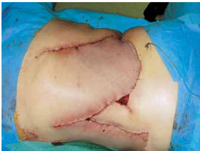
Fig. 3: Colgajo de perforantes lumbares rotado 90°.