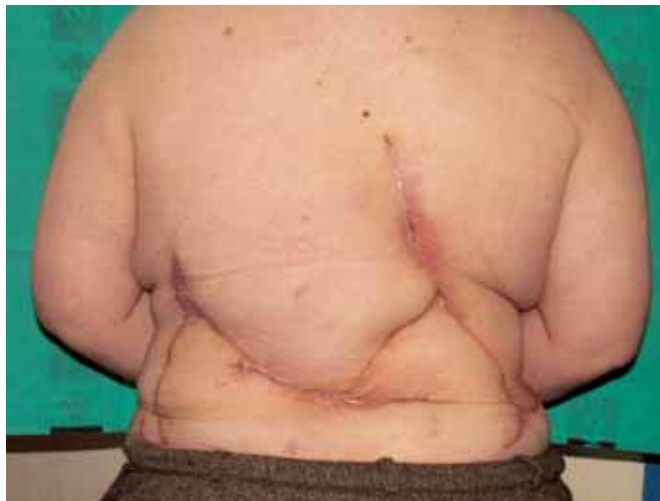
Fig. 6: Resultado final.