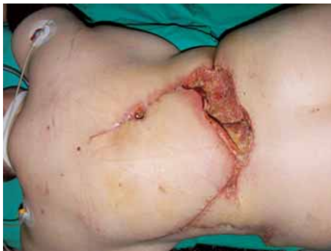
Fig. 4: Necrosis marginal del dorsal ancho desbridado.

de las cuatro arterias lumbares (1), pero se encuentra limitado en la rotación por el volumen del músculo, lo que condiciona sus posibilidades.