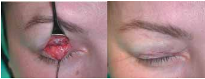
Fig. 7. Sutura del borde de resección del músculo al tarso con puntos de vicryl 6/0 con tensión para conseguir una hipercorrección de 1-2 mm. Cierre cutáneo.