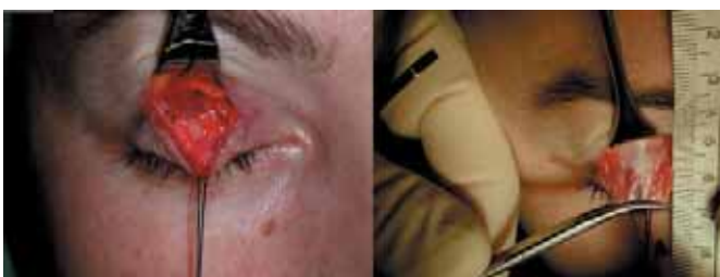
Fig. 5. y 6. Liberalización completa del elevador. Sección de la aponeurosis a nivel de su inserción en el tarso y clampaje con una pinza de hemostasia. Se marca el límite de resección y se procede a la misma.

Caso 7. Mujer de 48 años que acude para blefaroplastia estética; se le hace notar que presenta una blefaroptosis bilateral asimétrica de 6 y 7 mm. Corrección bajo anestesia local más sedación.