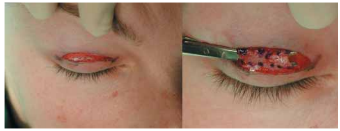
Fig. 2. Técnica quirúrgica abordaje cutáneo mediante incisión horizontal sobre el reborde tarsal del párpado superior que permite una exposición completa del músculo orbicular. Sección de una tira del músculo orbicular.