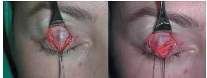
Fig. 4. Identificación de los bordes medial y lateral del músculo elevador, disección de la cara profunda separándola de la conjuntiva palpebral que permanece íntegra.

En los casos de ptosis muy discretas en los que realizamos solo una plicatura de la fascia del elevador sin desinsertarlo, continuamos después con el resto de la blefaroplastia si está indicada.