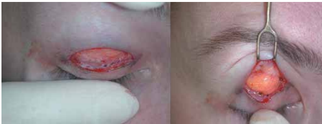
Fig. 3. Exposición de la aponeurosis del elevador para disección amplia en su superficie respetando las bolsas grasas orbitales.