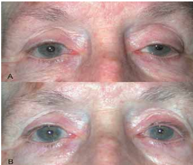
Fig. 8. Caso 1 Corrección unilateral de blefaroptosis izquierda preoperatorio y postoperatorio al mes.