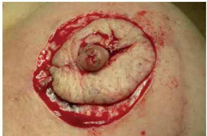
Fig. 6. Autoinjerto areolar.