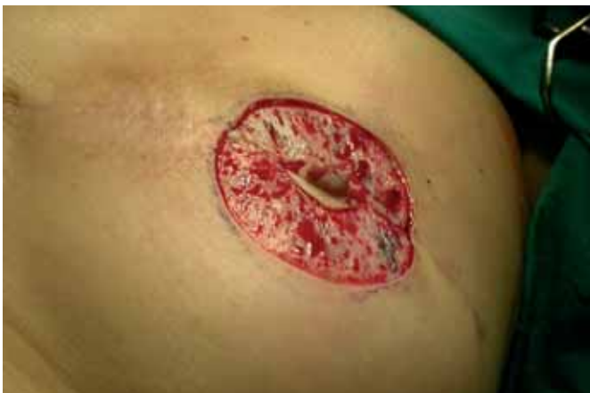
Fig. 5. Lecho areolar una vez desepitelizada la piel circundante.

La sucesión de complicaciones fue estudiada igualmente por la revisión de historias clínicas (n=4). Tres pacientes sufrieron necrosis del pezón, en 2 de los casos parcial y solamente en uno de los casos total (5%). Otra complicación posible, experimentada por una de las pacientes, fue la dehiscencia de la zona donante, que se trató con un injerto de piel total tomado de zona inguinal.