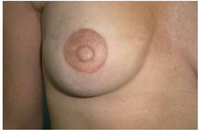
Fig. 8 Reconstrucción definitiva CAP mediante tatuaje, tras 1 año de evolución.

Respondiendo a la pregunta de cuál era el aspecto que les gustaría cambiar acerca de su reconstrucción, en orden descendente, fue la falta/pérdida de proyección del pezón (Fig. 9), la forma y simetría del CAP, las cicatrices post-reconstrucción, la coloración de la areola, la textura, el tamaño y la posición. No obstante, es importante señalar que el 22% de las pacientes respondieron que no cambiarían nada acerca de su reconstrucción.