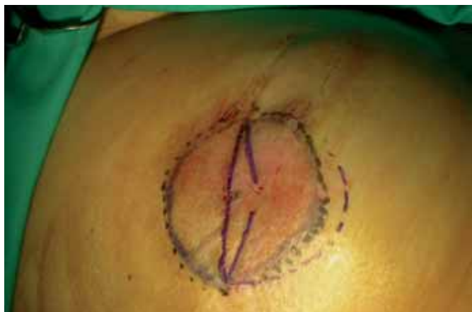
Fig. 1. Diseño intraoperatorio del colgajo en cola de delfin.

El estudio estadístico fue llevado a cabo por el análisis de la varianza y el test de Student.