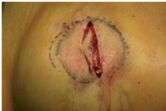
Fig. 2. Pasos intraoperatorios secuenciados de la técnica del colgajo en cola de delfin: Desepitelización del colgajo tipo delfin.