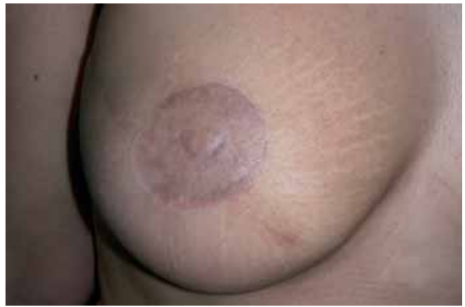
Fig. 9. Reabsorción- pérdida de proyección de pezón tras 1 año de evolución.

Entre los distintos aspectos que mostraban mayor disconformidad entre las pacientes, el más repetido