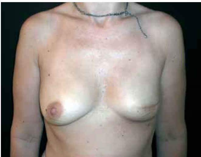
Fig. 1: Reconstrucción mamaria.