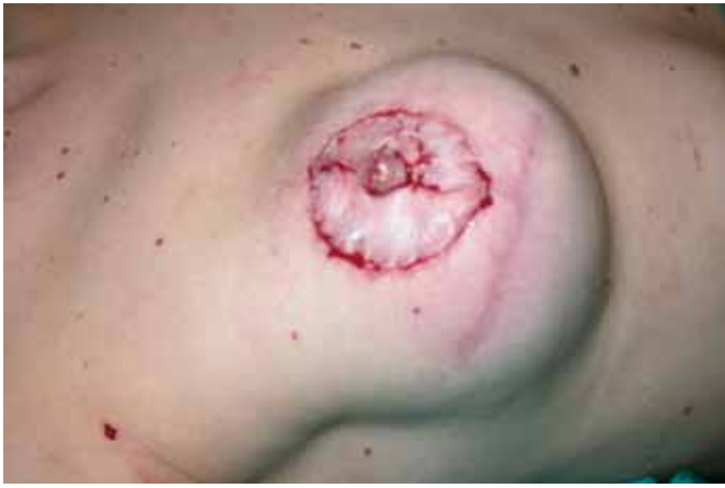
Fig. 7. Postoperatorio inmediato de reconstrucción con colgajo local de pezón y autoinjerto de areola.