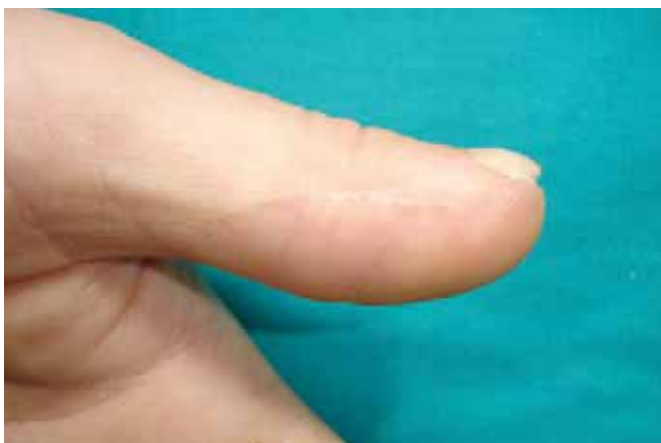
Fig. 4. Caso clínico nº 4. A: Amputación dorsal cubital de falange distal de primer dedo mano izquierda, diseño de colgajo en hacha. B: Elevación del colgajo en su variante sensible, preservando las aferencias vasculonerviosas bilaterales. C: Avance-rotación del colgajo. D: Resultado al año de la intervención.