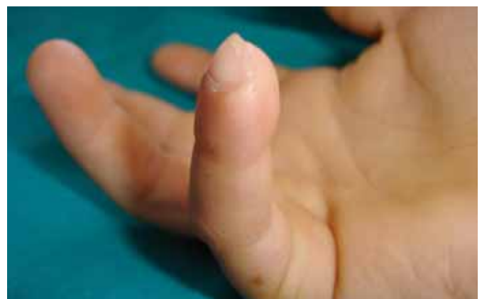
Figura 1. Caso clínico nº 1. A: Lesión dorsal transversa de quinto dedo mano derecha. B: Elevación del colgajo bajo torniquete digital. C: Resultado al año de la intervención.