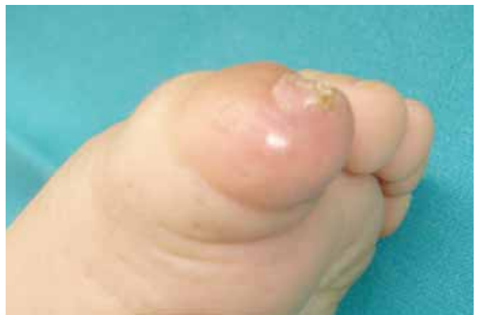
Fig. 3. Caso clínico nº 3. A: Luxación abierta de falange distal en primer dedo de pie izquierdo con pérdida de sustancia dorsal transversa. B: Osteosíntesis con aguja Kirschner y colgajo en hacha elevado. C: Resultado al año de la intervención.

Tallamos un colgajo triangular (Fig. 6C) en la cara volar del pulpejo y ubicamos la charnela del colgajo en función de la topografía del defecto y de la dominancia del dedo. Si es posible, evitaremos que la punta del colgajo cruce el pliegue interfalángico distal (Fig. 1B). Sin embargo, puede rebasarse este límite en defectos proximales (Fig. 2A). En el brazo largo del triángulo se realiza una incisión de espesor total hasta el vértice, respetando el pedículo neurovascular subyacente; en ese punto practicamos una incisión de descarga subdérmica hacia distal de aproximadamente un tercio de la longitud del lado