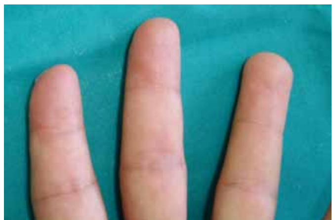
Fig. 5. Caso clínico nº 5. A: Doble lesión volar radial en segundo y tercer dedo de mano izquierda. B: Colgajo en hacha del segundo dedo suturado y elevación del colgajo para tercer dedo. C: Resultado al año de la intervención.

más largo (Fig. 4A). La elevación del colgajo respecta en la profundidad el eje neurovascular contralateral al pedículo, sin incluirlo en su espesor. En la medida de lo posible, debemos respetar en función del avance necesario las aferencias vasculonerviosas que de éste se dirigen a la piel (Fig. 4B). El colgajo así elevado, es avanzado y rotado sobre su punto pivote hacia el defecto (Fig. 4C) y anclado en posición mediante suturas interrumpidas de nylon 5/0 cerrando la zona donante mediante V-Y (Fig. 5B) o Z-plastia.