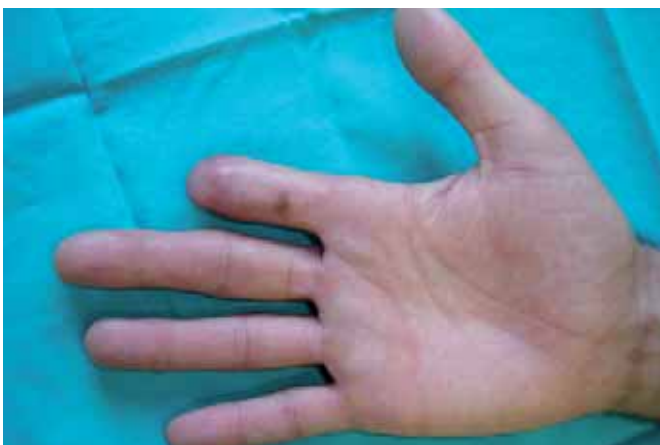
Fig. 2: Caso clínico nº 2. A: Lesión circunferencial en segundo dedo de mano derecha, diseño de colgajo en hacha para cobertura sensible del pulpejo. B: Colgajo de dedo cruzado asociado para cobertura de la punta. C: Resultado tras sección del pedículo a las tres semanas de la intervención. D: Resultado al año de la intervención.